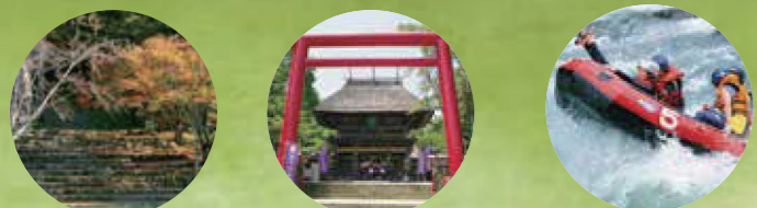
1 人吉城跡公園 2 国宝 青井阿蘇神社 3 球磨川ラフティング